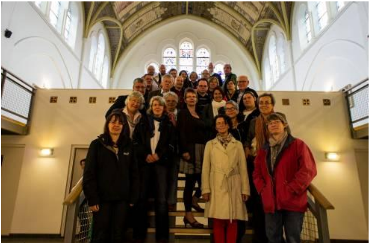
Gasten uit Gera samen met hun gastheren en -vrouwen uit Arnhem en Velp