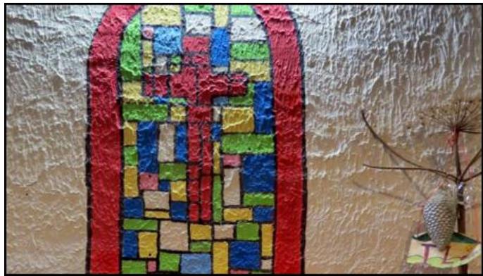
Foto: Liturgisch centrum in Het Kruispunt Arnhem.