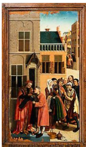
Kleden van naakten