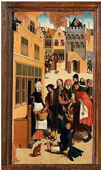
Spijzen van hongerigen

Tot slot van deze serie vindt u in dit Bulletin nog een keer alle afbeeldingen.