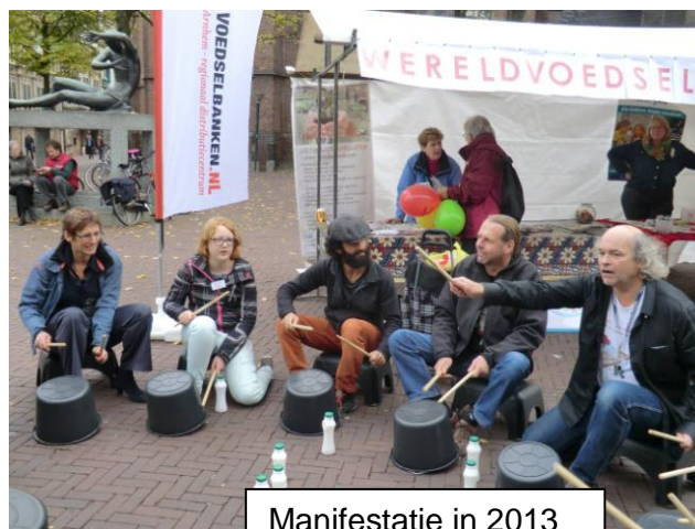
Manifestatie in 2013

Op 16 oktober is het Wereldvoedseldag en op 17 oktober Wereldarmoededag. In 2015 lopen de acht millenniumdoelen af die de wereldgemeenschap in 1990 heeft vastgesteld om armoede en honger uit te bannen. Hoewel de doelstellingen zeker niet helemaal gehaald worden, is er vooruitgang. Het aantal mensen dat onder de armoedegrens leeft van 1,25 dollar per dag is gehalveerd tot 22 procent. Er gaan meer meisjes naar school, de kinder- en moedersterfte is fors verminderd en miljoenen mensen hebben toegang gekregen tot schoon water. Toch leven nog steeds één miljard mensen in armoede, sterven miljoenen mensen onnodig aan tropische ziekten en is de positie van vrouwen en meisjes in veel landen erbarmelijk. Veel landen, waaronder Nederland, hebben hun uitgaven aan ontwikkelingssamenwerking fors verlaagd wegens bezuinigingen.