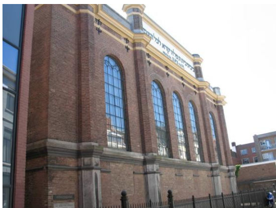
Synagoge aan de Pastoorstraat te Arnhem.

In dit Bulletin vindt u een ingekort verslag van de Internationale oecumenische conferentie die van 11-14 september in Arnhem werd gehouden. Voor belangstellenden is per mail een uitgebreider verslag beschikbaar. U kunt dit aanvragen door te mailen naar bulletin.rvkarnhem@gmail.com