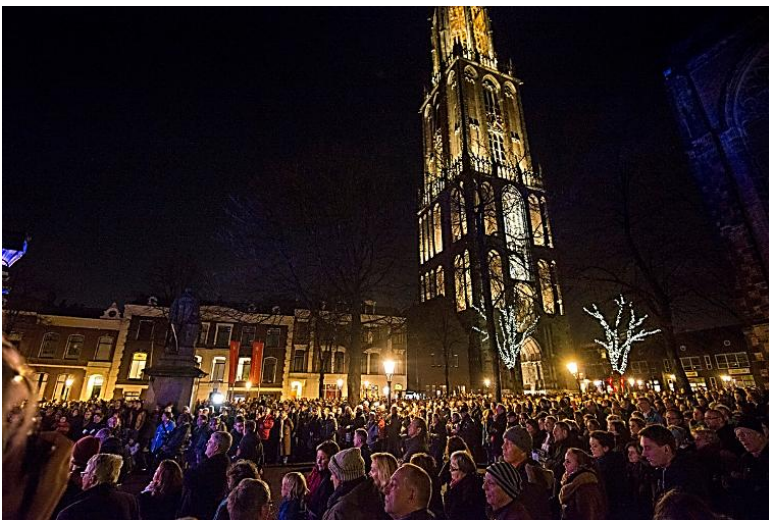
Domplein te Utrecht donderdagavond 8 januari