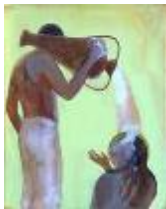
De dorstigen laven