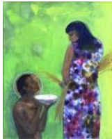
De hongrigen voeden

In het jaar van Barmhartigheid staan we stil bij de zeven werken die daarbij horen: