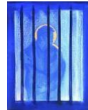
De gevangenen bezoeken