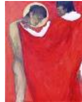
De naakten kleden