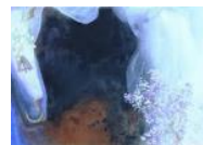
De doden begraven

We staan stil bij 7 meer actuele daden van barmhartigheid in onze samenleving, die voor vele medemensen “te hard is, onleefbaar, te snel, te hebberig, te ingewikkeld”: