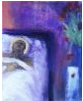
De zieken bezoeken