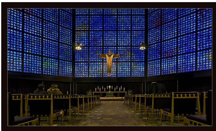
Gedächtniskirche in Berlijn