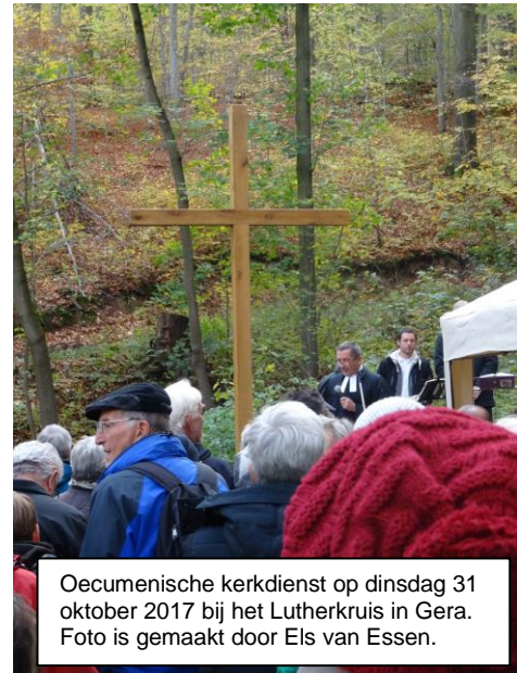
Oecumenische kerkdienst op dinsdag 31 oktober 2017 bij het Lutherkruis in Gera.

In dit Bulletin gaan we kort in op de Nederlandse inbreng tijdens deze ontmoeting met de Raad van Christelijke Kerken in Gera. Onze bijdragen stonden in het teken van Maarten Luther, gezien vanuit Nederlands perspectief. Zoals bekend komt het aantal Lutheranen in Nederland net boven de 10.000 uit, terwijl in Duitsland het aantal Lutheranen 12.000.000 bedraagt. Wereldwijd behoren 70.000.000 mensen tot de Lutherse kerken.