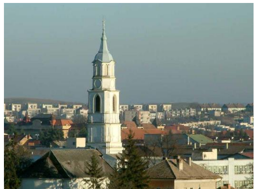
Rimavská Sobota, een stad gelegen in centraal Slowakije

Christian Church, gelegen in de stad Rimavská Sobota in centraal Slowakije.