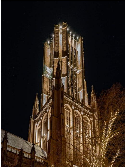
Toren Eusebiuskerk bij avond