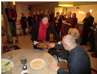
Foto: Nieuwjaarsontmoeting 2019