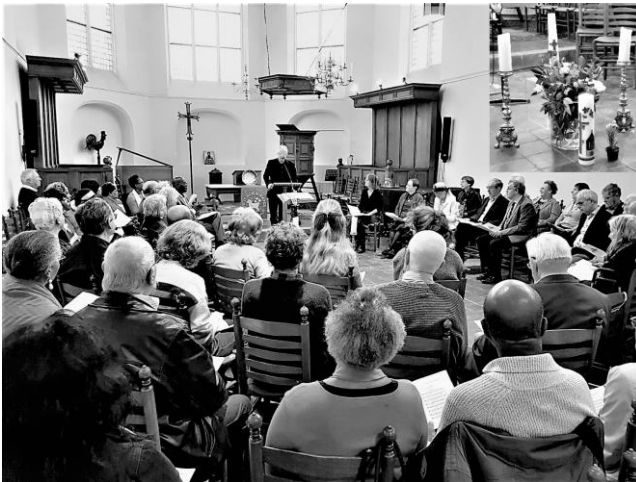
4Kerkenviering op 16 februari 2020 in de Waalse kerk (inzet: bloemen en vier kaarsen).

Het was een unieke gebeurtenis, die veel voorbereiding vergde. Dat was te zien aan de vlekkeloos verlopen ontmoeting in de Waalse kerk van vier geloofsgemeenschappen. De Waalse Gemeente, de Doopsgezinde Gemeente, de Evangelische Broedergemeente en Jansbeek Ekklesia hielden op zondag 16 februari 2020 een gezamenlijke viering, met als centraal thema verbondenheid , in het bijzonder van de vier gebruikers van deze kerk. Ieder bracht een kenmerkend voorwerp mee. Voor DGA was dat, niet verrassend, een Delfts blauw wandbord met de Doperse spreuk erop. Verder waren er zilveren kannen, een kruis