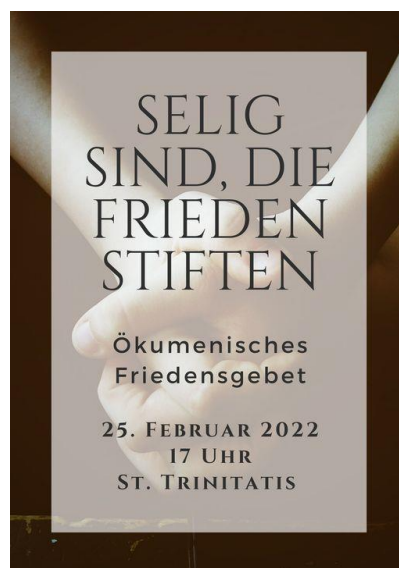
Foto: Poster oecumenisch vredesgebed in Gera