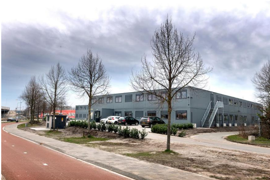
INLIA Gasthuis Groningen

Ruim tien jaar geleden deed het Europees Comité voor Sociale Rechten van de Raad van Europa (ECSR) de belangwekkende uitspraak over het basisrecht van ieder mens op voeding, kleding en onderdak, waaruit de 'Bed-Bad-Brood' voorzieningen in Nederland zijn ontstaan.